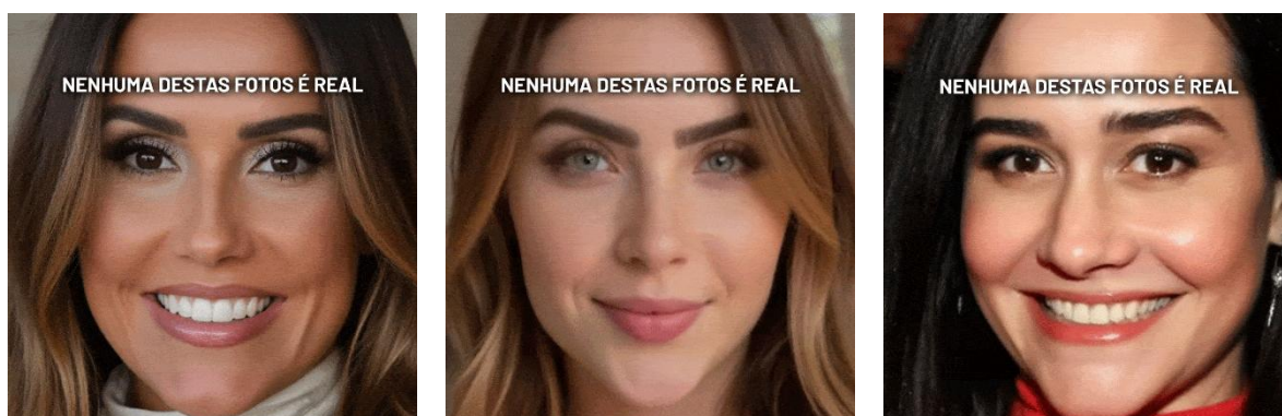
Figura 3: Captura de tela da publicação feita pela Pulitzer Center , utilizando o aplicativo SeaArt , em 25/07/2025.