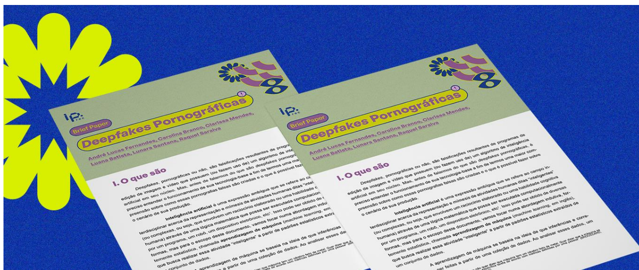
Imagem 2. Brief paper elaborado pelo IP.rec

No Brasil, materiais como a coletânea Enfrentando Deepfakes 17 reúne pesquisadores, juristas e ativistas para refletir sobre aspectos sociais, técnicos e jurídicos do tema. Já o Instituto de Pesquisa em Direito e tecnologia de Recife (IP.rec) publicou o Brief Paper – Deepfakes Pornográficas 18 , que traz dados alarmantes sobre o crescimento desse tipo de conteúdo e discute a necessidade de políticas que responsabilizem plataformas, protejam vítimas e promovam educação digital.