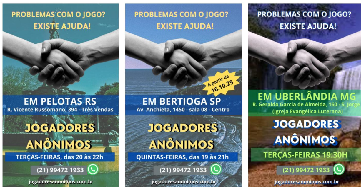
Figura 2. Divulgação do grupo de apoio Jogadores Anônimos.

Pesquisa feita pela Universidade Federal de São Paulo (Unifesp) mostra que 10,9 milhões de pessoas fazem uso perigoso de apostas no Brasil 15 . Isso evidencia o caráter necropolítico 16 do setor, pois não se trata mais de gerir a vida, como na biopolítica 17 , mas de rentabilizar a sua destruição.