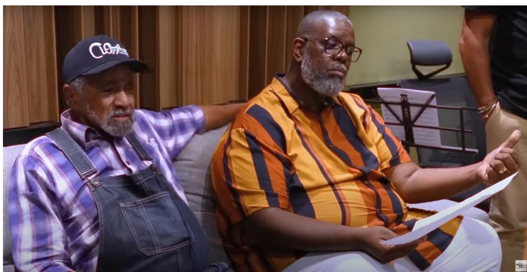
Figura 1 - Videoclipe “Imã”, música gravada com voz reconstruída de Cléber Augusto.

É o caso da popular campanha da Volkswagen com a Elis Regina 5 e, em 2025, do projeto audiovisual “Minhas Andanças” em que houve a reconstrução da voz sambista Cléber Augusto com inteligência artificial 6 :